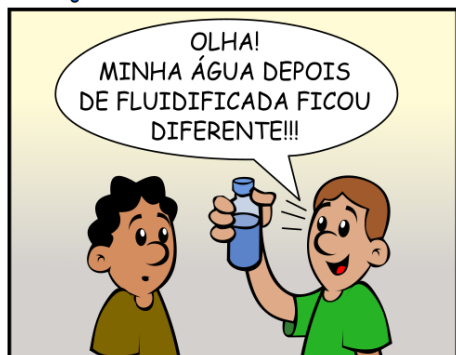
285 - MINHA GARRAFA