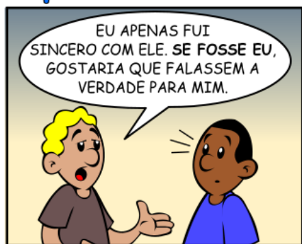
269 - SE FOSSE EU